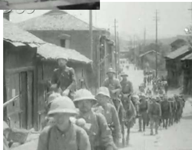
進軍する陸軍部隊・中国戦線