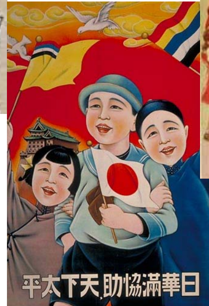
仲良し「幸せのあふれる映像」 ⇒「戦うのではなく」「救う」