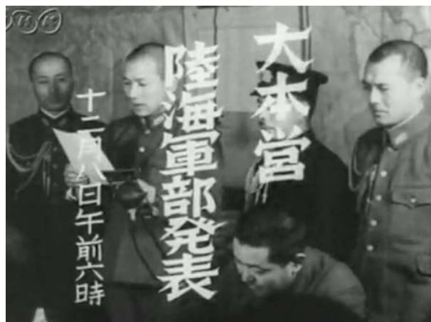
開戦の日・大本営会見