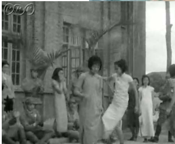
中国の女性たちと日本軍兵士 日本ニュース31号から