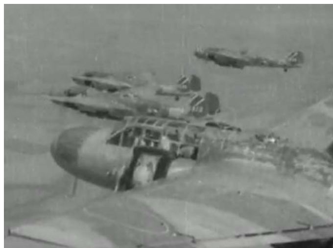
重慶爆撃の海軍機