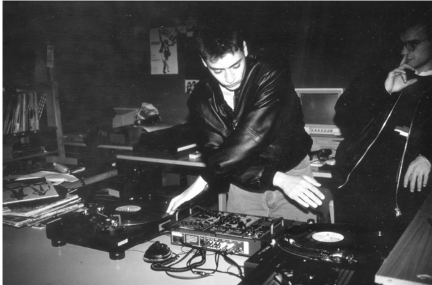
Abbildung 1: Das Jugendzentrum als ein entscheidender Ort der frühen Konsumtion und Produktion von Rap-Musik in Deutschland. Mitglieder der türkisch-deutschen Rap-Gruppe Karakan üben zu Beginn der 1990er Jahre im Nürnberger Jugendhaus Gostenhof DJ-Techniken.

Publikum in Live-Situationen zu präsentieren. Homebase drückt das Gefühl der Verbundenheit mit einer solchen Lokalität aus, an der sich Freunde und Bekannte treffen, um gemeinsam zu musizieren und Musik zu konsumieren.