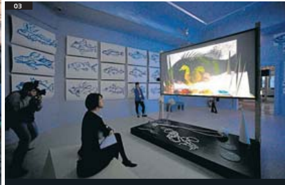
RELIGIÓ, NATURA I MEMÒRIA 01. La mesquita del pavelló islandès, MACIEJ KULCZYŃSKI / EFE 02. Case 1303 , de l'iraquí Haider Jabbar, HAIDER JABBAR 03. Un àmbit de l'exposició de Joan Jonas, BIENNALE 04. El pavelló del Japó, BIENNALE