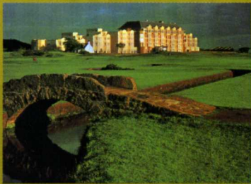
ゴルフファンの夢「オールドコース」と「オールドコース・ホテル」