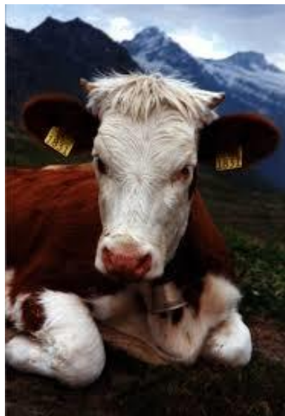
Vache Race SIMMENTAL (BAVIERE)

Votre boucher doit vous proposer des pièces entières qu'il découpera à votre demande.