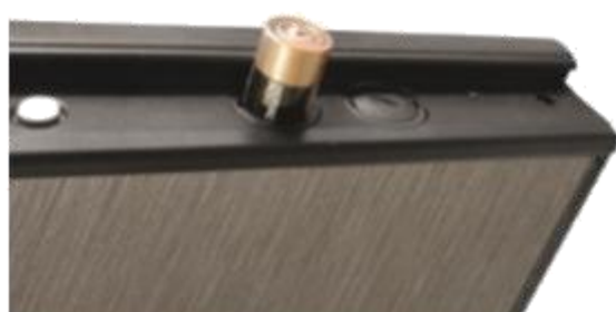
Alimentation par 6 piles LR20

Attention, la mise en place de cette option rend caduque les PV coupe-feu des portes Fichet équipées.