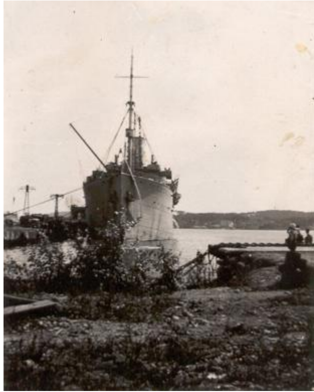
האניה "מטרואה", על סיפונה עלה יוסף ארצה