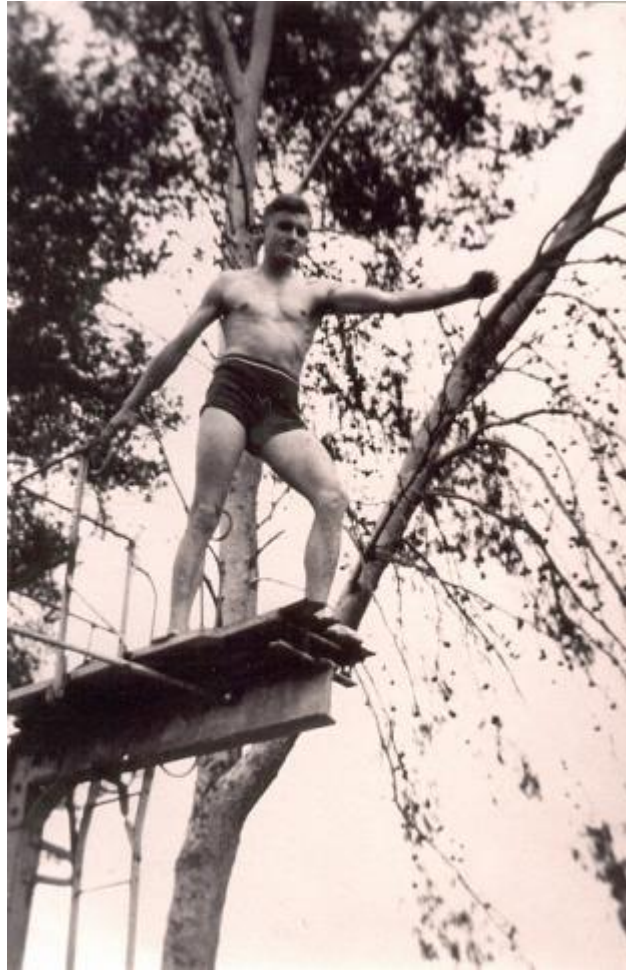
על מקפצה ב"מקווה ישראל"