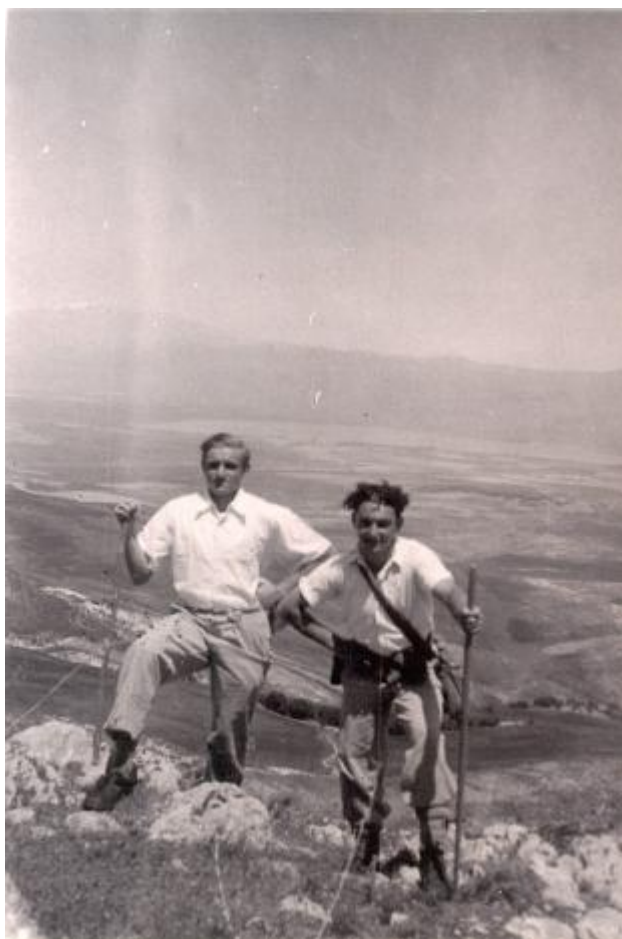
במהלך טיול, בזמן שלמד ב"מקווה ישראל"