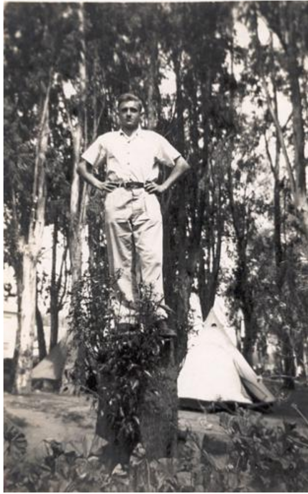
על עץ ב"מקווה ישראל"