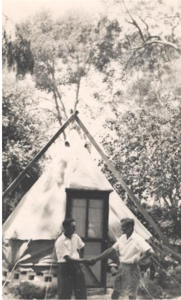
האוהל של יוסף