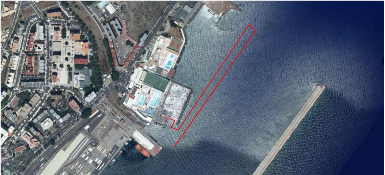
Imagen aproximada con el plano de situación de la salida de la prueba, boyas del recorrido, aproximadas, y llegada.

Distancia 3.000m. El comienzo de la prueba se hará a las 12:30h desde el Puerto deportivo del RCNT , los nadadores se dirigirán al agua, donde se realizará la salida para poder empezar a nadar. La prueba consistirá en una vuelta al circuito señalado, con llegada a meta situada en la rampa del varadero situado dentro del puerto deportivo del RCNT. Una embarcación abrirá la prueba y otra la cerrará. Se dirigirán en línea recta dirección “NE” , hacia Playa Valleseco, las boyas delimitación/orientación de las aguas del puerto rojas están dispuestas aproximadamente, cada 30 metros, y las boyas dispuestas por la organización más grandes, Rojas o Amarillas, que se encontraran cada 200 m aproximadamente, en la misma línea de recorrido, a la altura del Muelle de las Carboneras ( Valleseco ), se producirá en la el primer giro a la izquierda en la boya de referencia , dirigiéndose a la segunda boya situada a unos 50 m , donde giraran de nuevo a la izquierda , dirigiéndose en línea recta dirección “SO” hacia el RCNT, con llegada a meta situada en la rampa del varadero situado dentro del puerto deportivo del RCNT ,donde se encontrara situada la línea de META, dónde el cronochip detectará el tiempo de llegada.