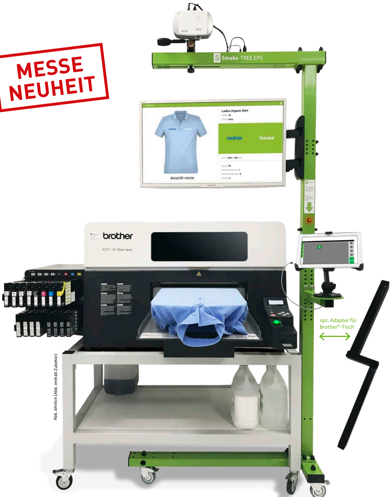
Abb. ähnlich (Abb. enthält Zubehör)

Optimiert für brother® Digitaldirektdrucker