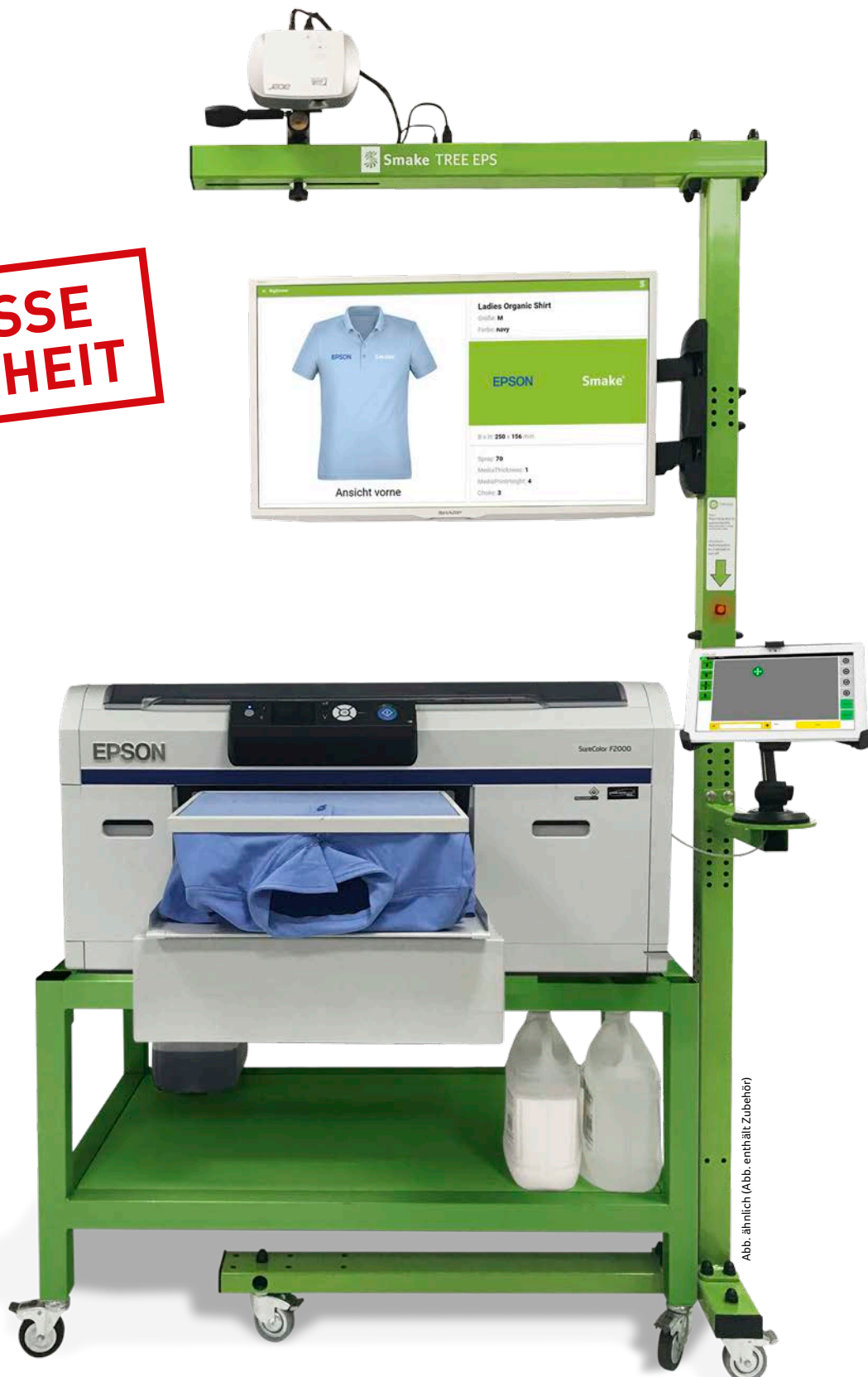
Abb. ähnlich (Abb. enthält Zubehör)