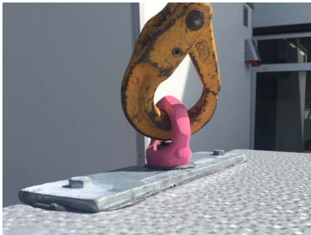
Gjennomgående stålstag i vegg. Løfteøye RUD VRM M-16 1,5 T