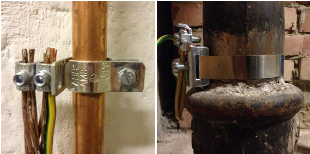
Eksempel på jording (utjevningsforbindelse) til vannrør og soilrør.