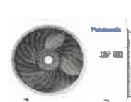
Utedel Eco 6.3 / 7.3