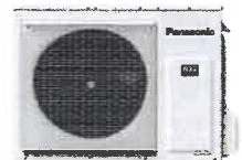
Utedel Eco 8,2