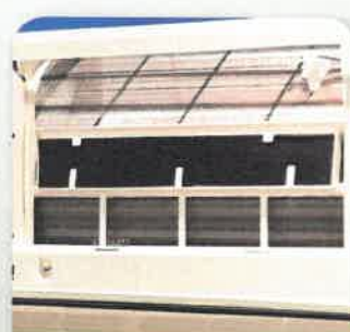
Aktivt kull filter