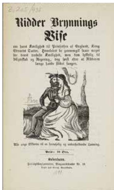
Forsiden på det nyeste kjente trykket av Brynning , trykt i 1891 og 1901.

og halve strofer fordelt på rollene «Mand», «Gulandam» og profeten «Aysa». 66 Særlig dette skillingsstrykket ser ut til å oppfordre til amatørmusikkteater blant slekt og venner. I Brynning inviterer dette innslaget leseren av trykket til å se kong Edvard tydeligere for seg som selvstendig figur. Kan det ha vært slik at disse utgivelsene la til rette for en form for rollespill i framføringen, enten i form av vekselsang mellom ulike forsangere, eller variasjon i framføringen fra en enkelt forsanger?