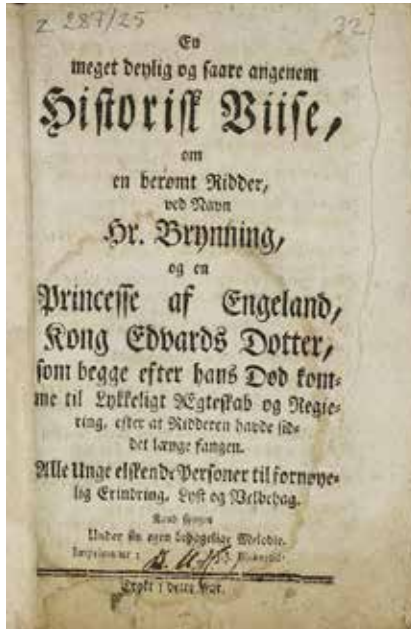
Forsiden på den første utgaven av Ridder Brynnings vise . 1