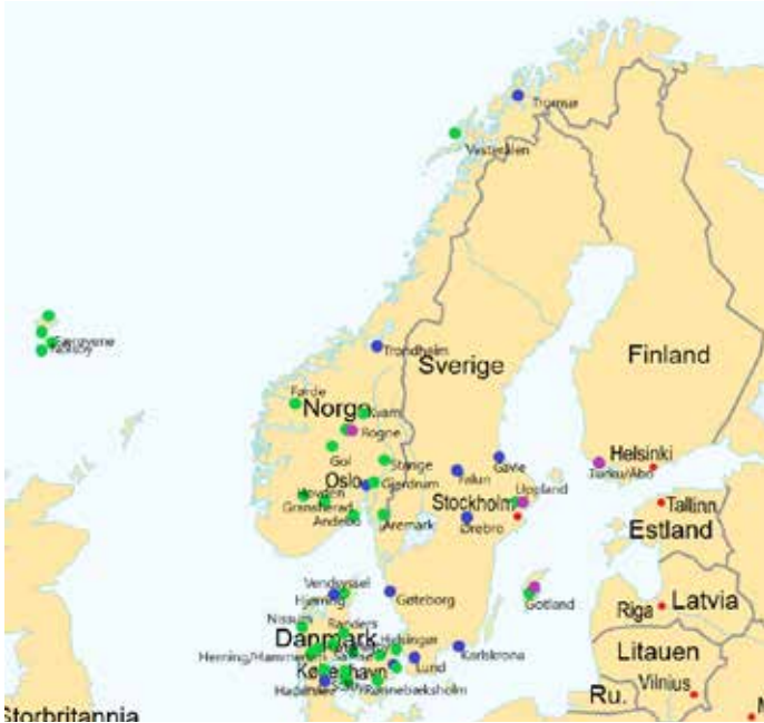
Kart over trykk (markert med blått), melodier (markert med grønt) og håndskrifter/muntlig tradisjon (markert med lilla) av Brynning i Norden. 15