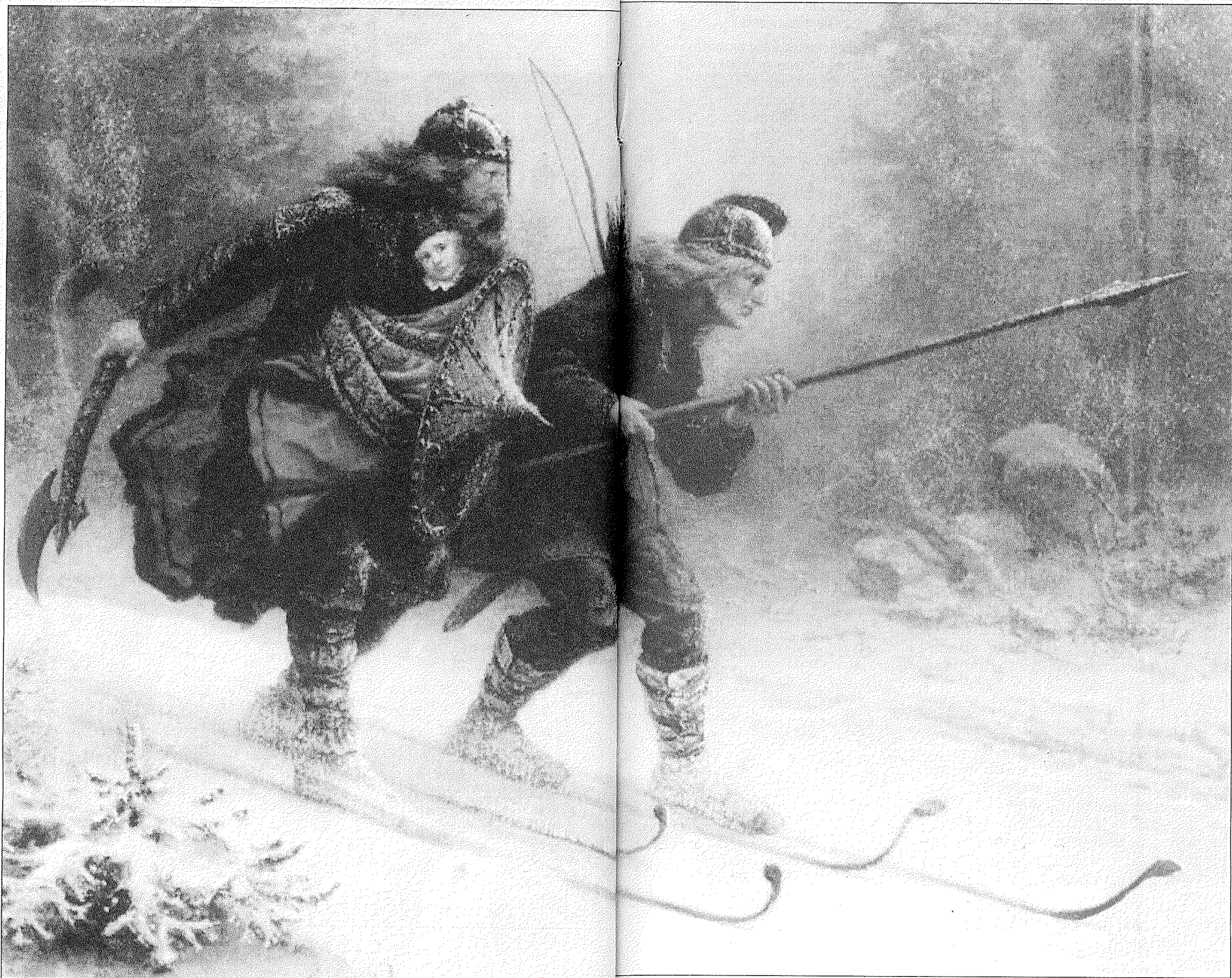
HÅKON: Det norske ikonet fra høymiddelalderen: Knud Bergslisens maleri av den lille Håkon Alv Erlingssons makt et halvt hundreår senere.