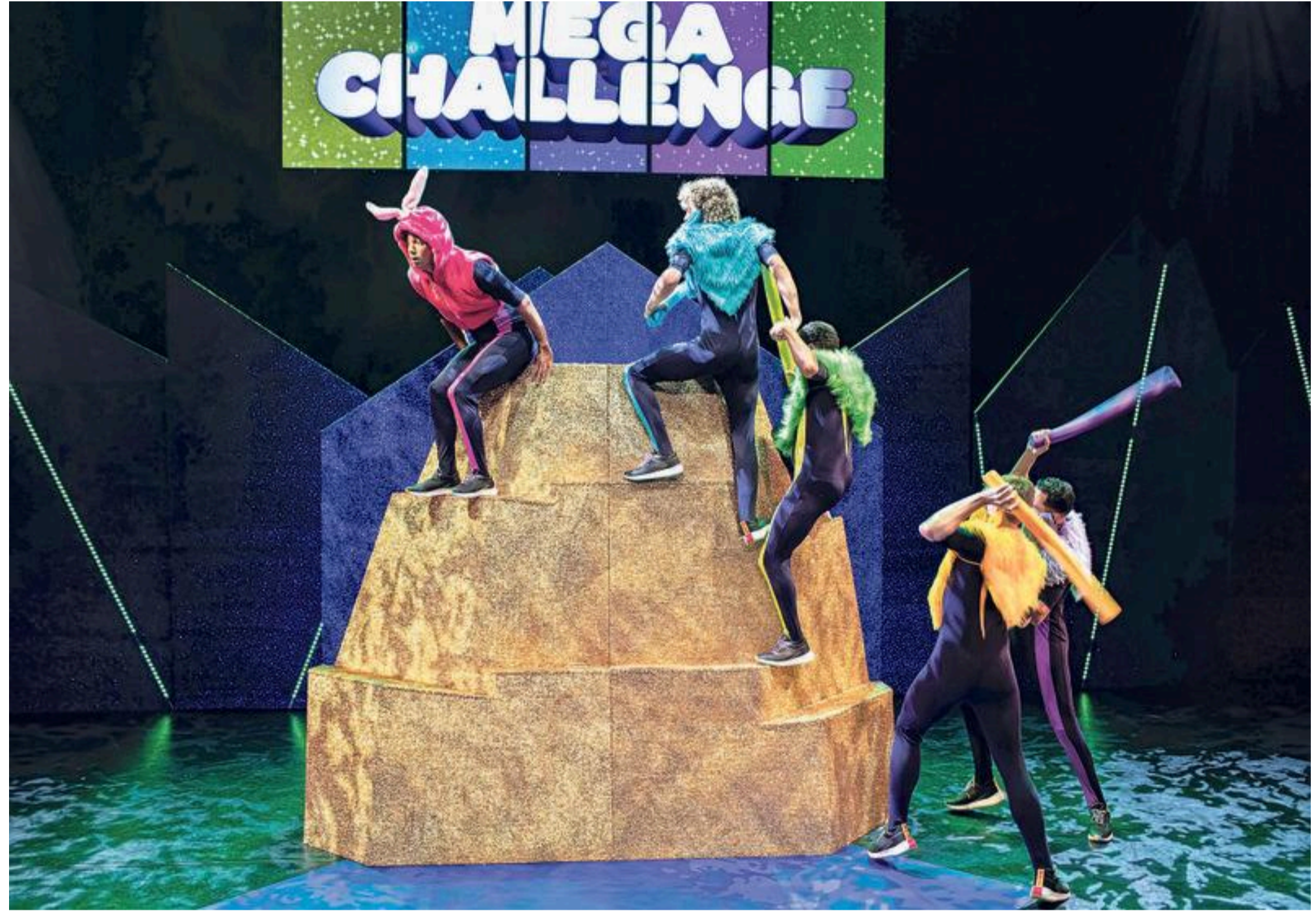
Scene uit 'De Grote Red Je Reet Show'.