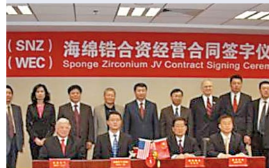
Het ondertekenen van de joint venture contracten

De bedrijven hebben aangekondigd dat de nieuwe fabriek in Nantong in China in 2012 in bedrijf komt. De fabriek zal zirkonium produceren voor zowel de Chinese markt als voor Westinghouse's Western Zirconium Plant in Ogden, Utah.