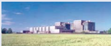
Bradwell: mogelijke locatie in het Verenigd Koninkrijk voor een nieuw te bouwen kernreactor?

In het aangekondigde actieplan is geen rekening gehouden met de heropleving van kernenergie maar betreft een op zichzelf staand overheidsproject. In 2007 zijn een nieuw energiebeleid en een white paper over kernenergie vastgesteld. Hierin staat dat de beschikbaarheid van kernenergie het algemeen belang dient en dat de overheid moet waarborgen dat het een levensvatbare optie blijft. Het bepaalt dat bedrijvers van kerncentrales zelf volledig in de kosten van de bouw, de ontmanteling en het afvalbeheer moeten voorzien. Voor kernenergie in Groot-Brittannië zijn de plannen voor de bouw van vier nieuwe grote kerncentrales in een vergevorderd stadium. Een verdere uitbreiding met nog eens tien kerncentrales is gepland. Uiterlijk 2080 zouden deze eenheden in bedrijf moeten zijn.