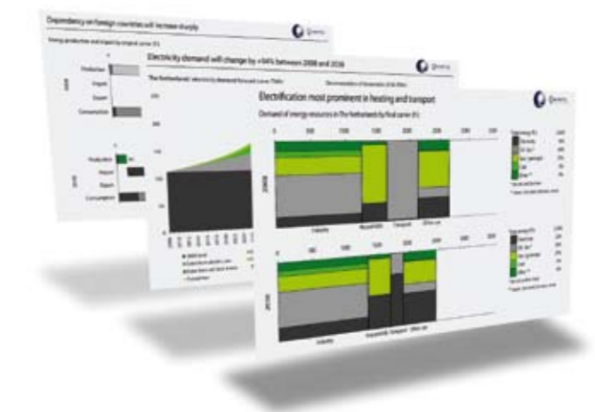
FIGUUR 4 Het Energietransitiemodel bevat ongeveer 20 interactieve pagina's. Binnen een uur tijd kan een volledig scenario gebouwd worden voor de Nederlandse energietoekomst.

Momenteel wordt het Energietransitiemodel gebruikt in studieprogramma's, ter ondersteuning van beleidsvorming van politieke partijen en als discussiemiddel in directiekamers. Met de professionele versie van het model kunnen bedrijfsstrategieën en overheidsbeleid worden doorgerekend. Omdat de Nederlandse energievoorziening een thema van nationaal belang is hebben Quintel en alle betrokken partijen besloten om een publieke versie van het Energietransitiemodel beschikbaar te stellen (zie ook figuur 4). Op deze manier willen we bijdragen aan een snelle transitie naar een duurzame toekomst. We nodigen iedereen dan ook uit om een eigen transitie scenario samen te stellen. Het Energietransitiemodel is gratis te downloaden via: www.energietransitiemodel.nl .