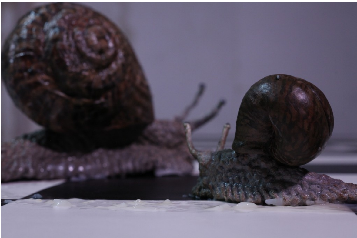
Stuart Middleton, keep going, 2018. Stop-Motion-Animation mit Ton, 6:24 Min.