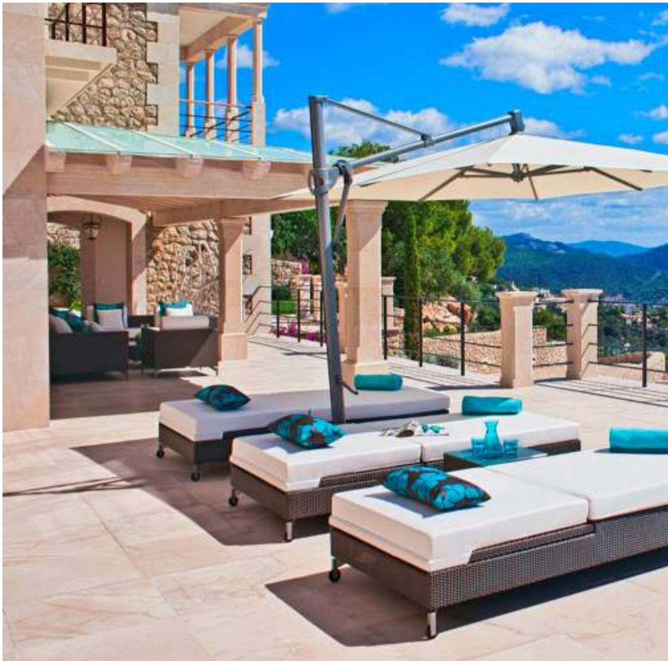
PAMPIGT. För 9,6 miljoner euro får köparen en nybyggd trevåningsvilla på 700 kvadratmeter i Puerto Andratx. Flera öppna och täckta

”Den sjunkande kursen för euron betyder väldigt mycket för våra svenska kunder. Ökad flygtrafik gör det också lättare att ta sig hit.”