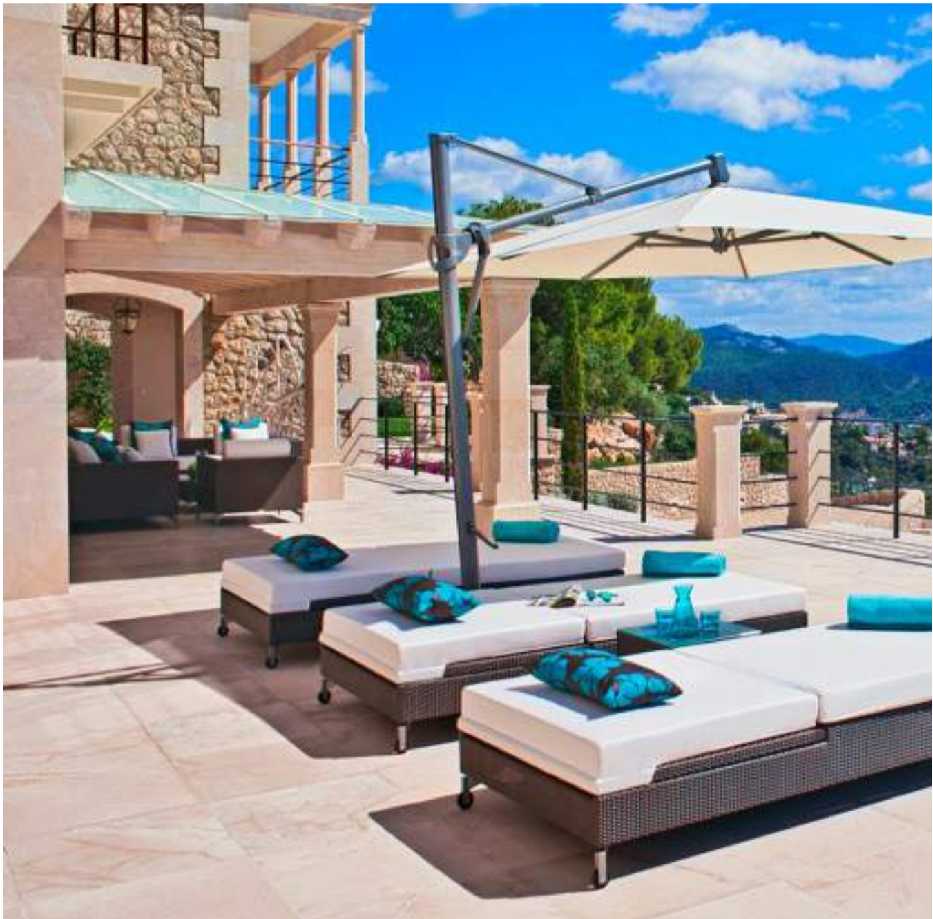
PAMPIGT. För 9,6 miljoner euro får köparen en nybyggd trevåningsvilla på 700 kvadratmeter i Puerto Andratx. Flera öppna och täckta