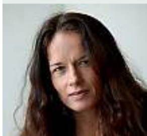
TV-PERSONLIGHET. Malin Berghagen.