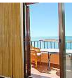
lägenheten i Bendinat.