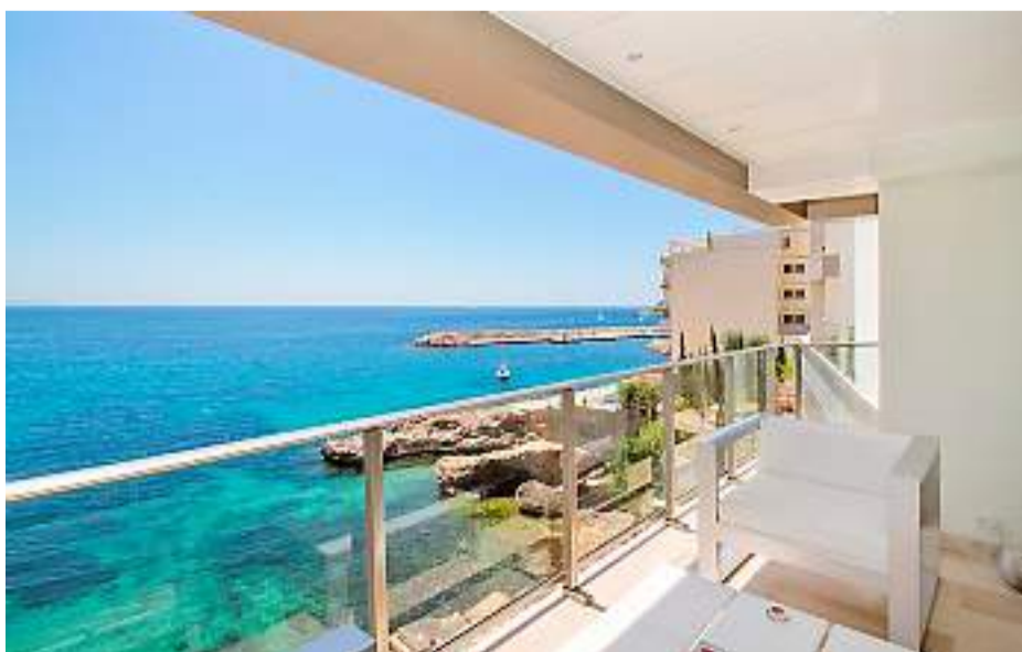
ÖPPET. I San Agustin ligger den här lägenheten på 82 kvadratmeter. För 756 000 euro kan man bli ägare till en bostad med öppet kök, två sovrum med varsitt badrum och terrasser under tak.