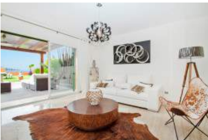
DUBBEL. I Nova Santa Ponsa ligger en 107 kvadratmeter stor lägenhet med två terrasser som säljs för 895 000 euro.