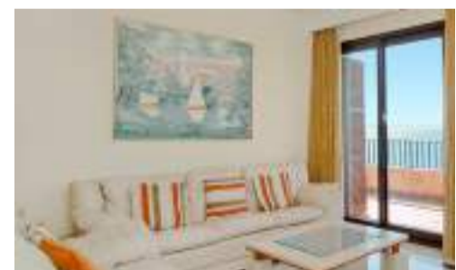
DELAD POOL. Havsutsikt och gemensam pool har den här 210 kvadratmeter stora