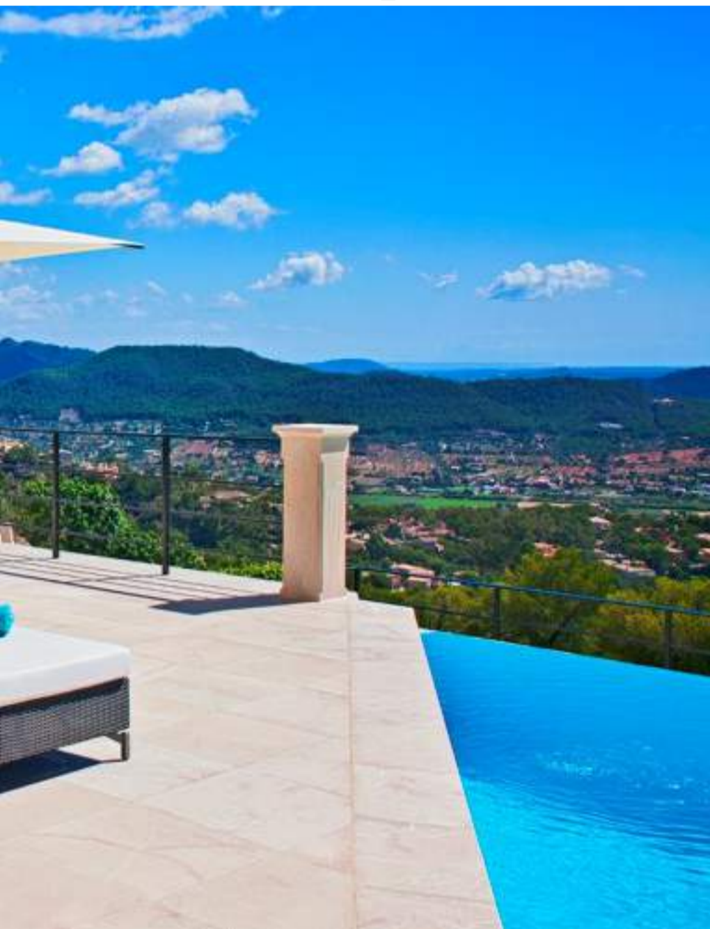
terrasser på sammanlagt 110 kvadratmeter ingår samt ett poolområde, spa och trädgård.