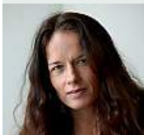
TV-PERSONLIGHET. Malin Berghagen.