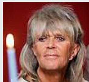
PRINCESSA. Birgitta av Hohenzollern.