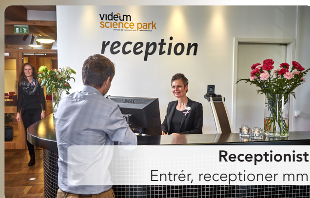
Receptionist Entrér, receptioner mm