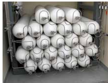
Fordonsgasen komprimeras till 250 bar för lagring och transport. Man får med sig 4 000 m 3 på ett lastflak.