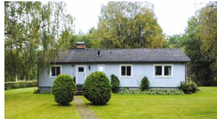
”Villan” ligger i anknäring till övriga verksamheter på Skåningegård. Här ges möjlighet till ett specialanpassat boende.

nära tillgängligt dygnet runt och lokalerna är väl anpassade för rullstolar och andra hjälpmedel.