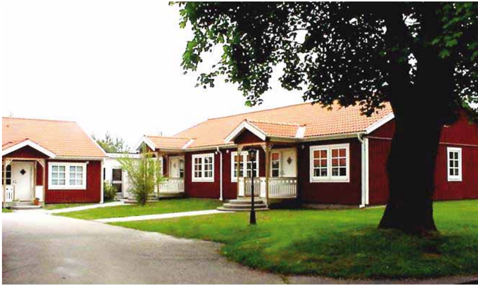
Servicebostäderna består av tvårumslägenheter med hög standard, samtliga i bottenplan.