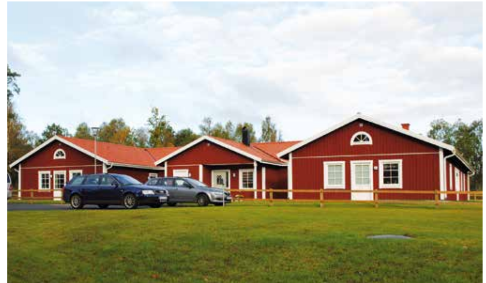
Ainagården är en nyare del av Skåningegård med sex lägenheter och centrala gemensamhetsutrymmen.