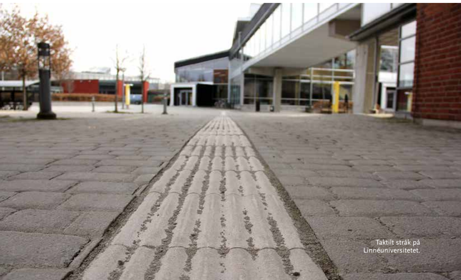
Taktilt stråk på Linnéuniversitetet.