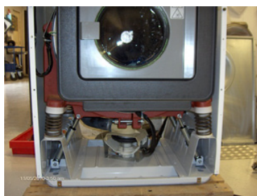
5. Maskinen monteras ihop och trasiga delar byts ut. Plåtarna lackeras om och monteras.