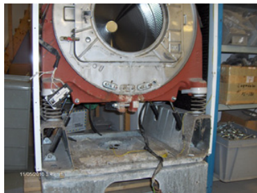
1. Så här ser maskinen oftast ut innan renovering.