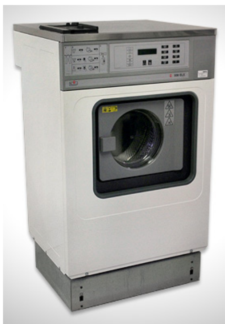
7. Den helrenoverade maskinen provkörs och kontrolleras så allt fungerar som det ska. Sedan packas den ordentligt för transport ut till våra kunder.