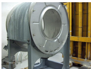
4. Hela stommen rengörs och lackas.