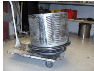
3. Trumman tas ut och renoveras med bl.a. nya lager.