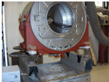
2. Maskinen plockas ner helt.