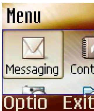
Tekst i fokus