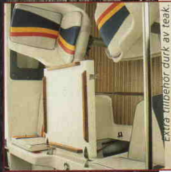
Extra tillbehör duk av teak.