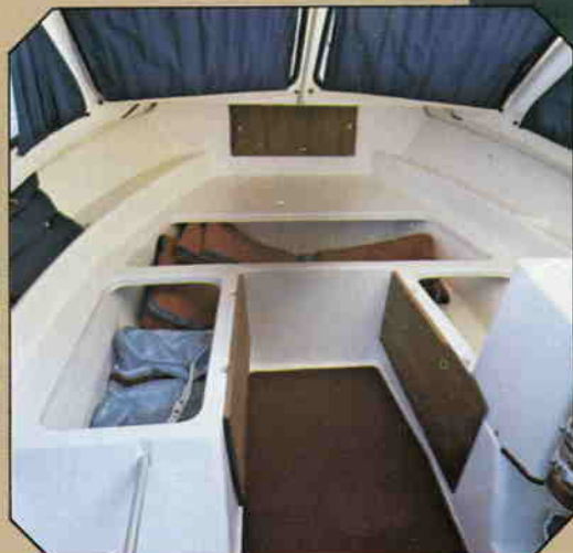
Mängder av stuvutrymmen.