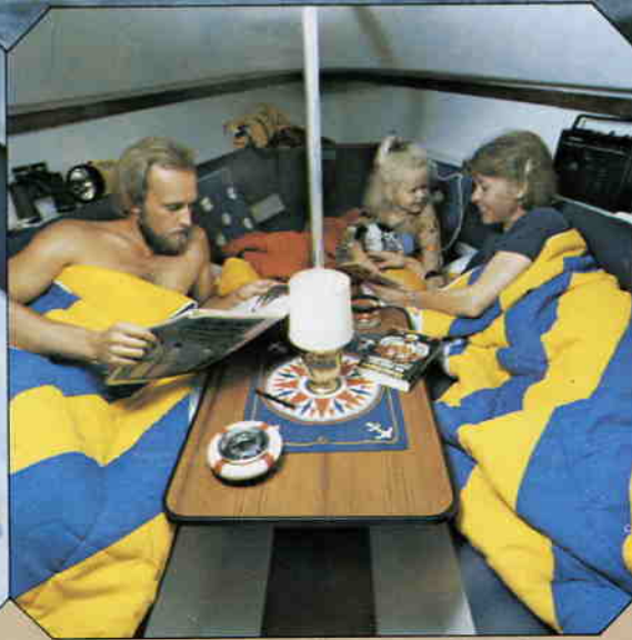
Höj- och sänkbart matbord.