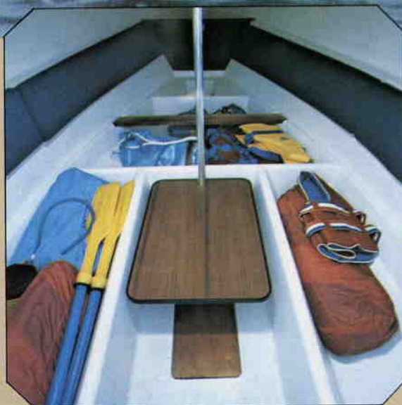
Gott om plats för packning.