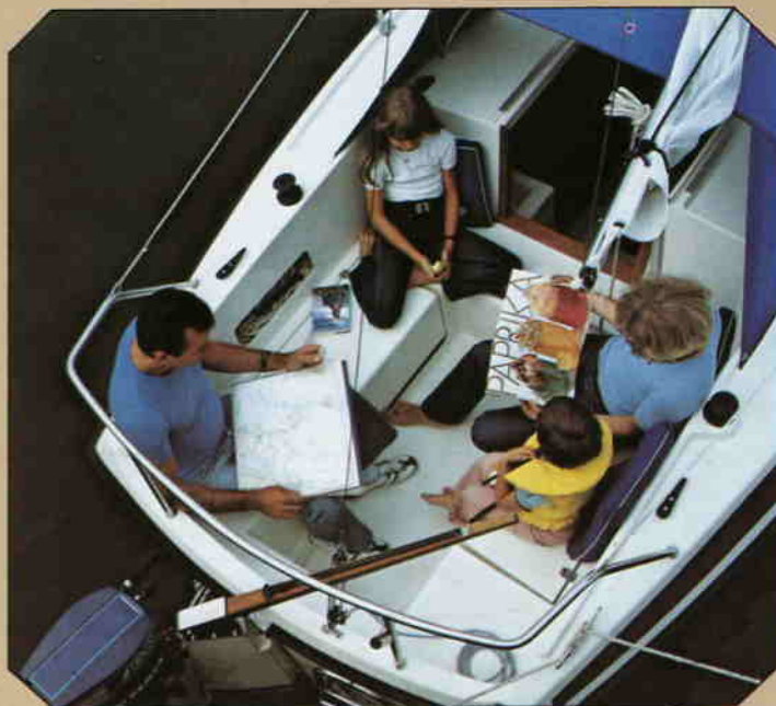
En mycket rymlig sittbrunn ger plats för hela familjen.