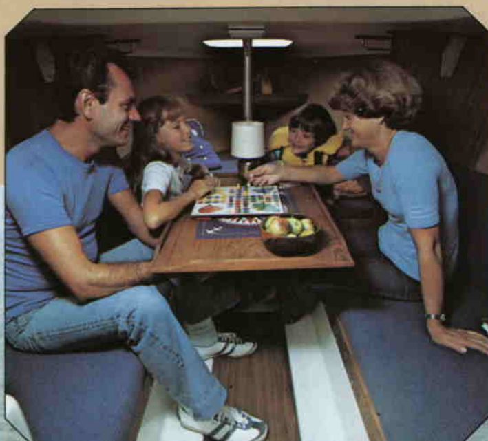
En väldisponerad och smakfullt inredd ruff.