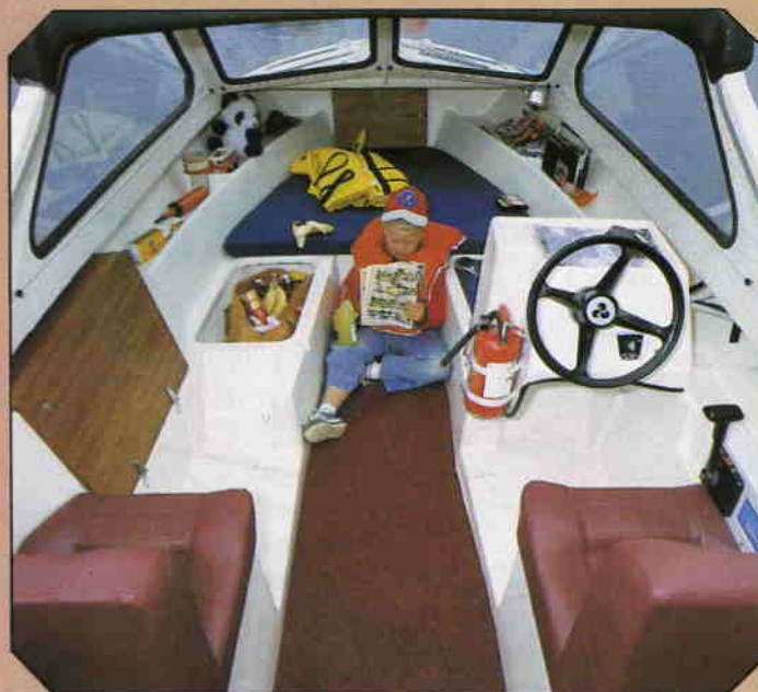
Rymliga stuvutrymmen med plats för det mesta.

Fartbåten om vilken Båt för Alla skrev: "En av de bästa sjöbåtarna i den här storleksklassen." En tuff sportbåt för alla åldrar. Lättmanövrerad i höga farter och i hård sjö.