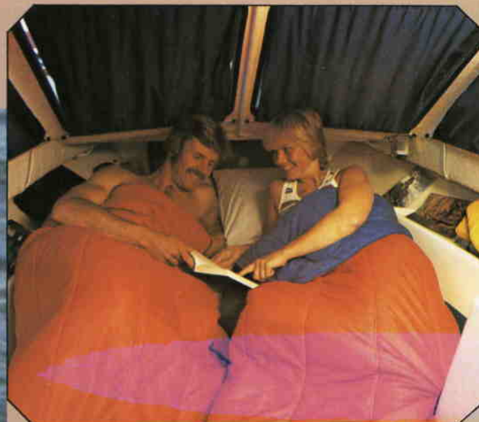
En "lagom" stor HT-båt med många möjligheter – det är TRISS 49 HT.