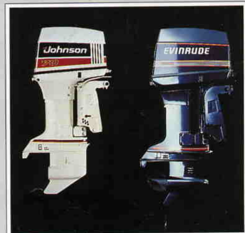
Standardutrustas med 70 hk, Johnson eller Evinrude.

RYDS 530DC har fasta punkterings-säkra flytelement av polyuretanskum som håller båten flytande med fem personer, motor och full last ombord även om båten blir vattenfylld.