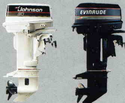
Standardutrustas med följande motor: 30 hk. Johnson eller Evinrude

Tillbehör: vattenskidbåge, dynsats akter, hamnkapell.