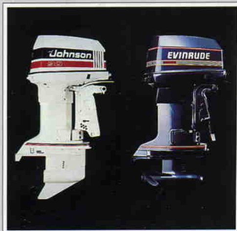
Standardutrustas med 90 hk, Johnson eller Evinrude.