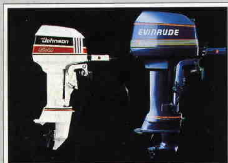
Standardutrustas med 6 hk. Johnson eller Evinrude

RYDS 320, extrabåten vid stugan, badbåten eller lilla transportbåten mellan brygga och boj.