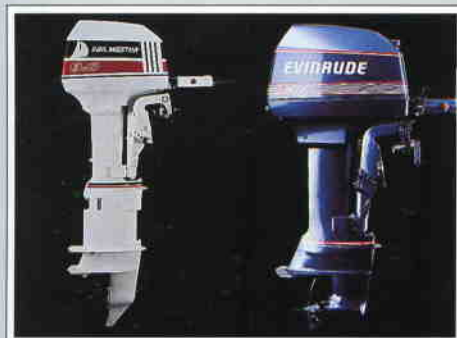
Standardutrustas med 8 hk. Johnson eller Evinrude