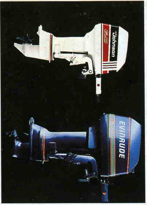
Standardutrustas med 6 hk. Johnson eller Evinrude

RYDS 320, extrabåten vid stugan, badbåten eller lilla transportbåten mellan brygga och boi.