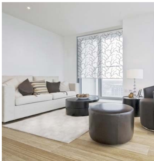
Figur 2. Rullgardin

Rullgardiner, plissé-/duettegardiner, lamellgardiner och persienner är en del av de invändiga solavskärmningarna som finns.