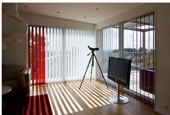
Figur 3. Lamellgardin