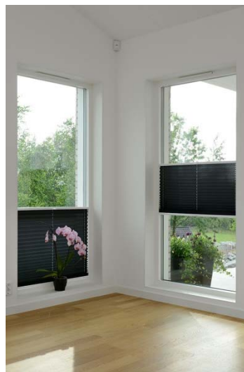
Figur 1. Plisségardin