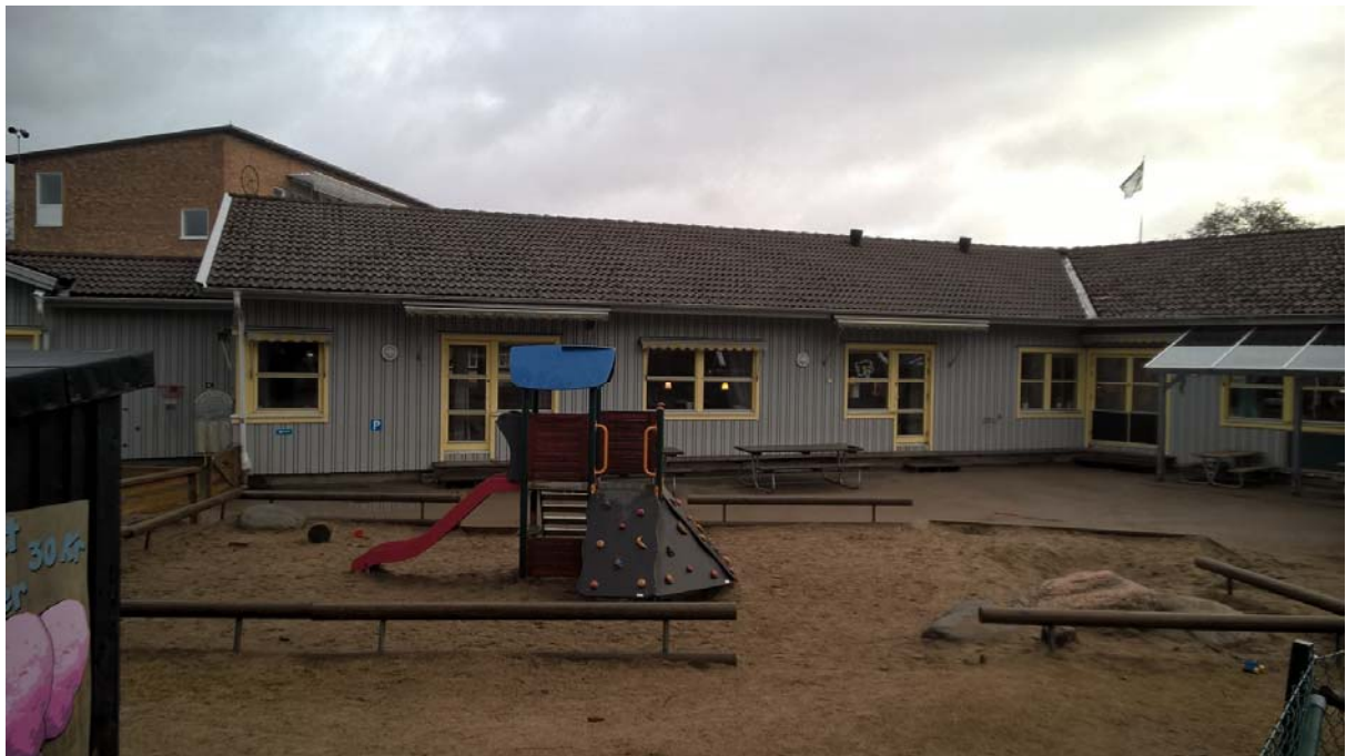
Förskolan Kastanjen, baksida som vetter mot söder.

De persienner som fungerar och används har ytterligare en nackdel enligt personalen. När persiennen används förlorar man all visuell kontakt med utsidan. Detta är inte alls bra då det är viktigt att den personal som befinner sig på insidan har bra utsikt över uteplatsen med sandlåda, rutschkana och andra lekplatser. Ett bländskydd med viss öppningsfaktor i väven skulle möjliggöra att upptäcka exempelvis olyckor även om man permanent eller tillfälligt befinner sig på insidan. Utvändiga markiser kan också vara ett alternativ, det som ska tas hänsyn till är kostnaden som ökar om man ska ha ett system med automatik samt beroende på årstid och val av markis att den minskar den visuella kontakten med utsidan och när solinstrålningsvinkeln är låg fungerar sämre som bländskydd. De två viktigaste aspekterna som framkom var bländskydd samt den upplevda temperaturen.