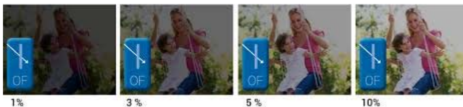
Illustration av öppningsfaktor som i detta fall är avgörande för att tillgodose personalens behov.

I denna beräkning har vi dessutom varit noga med att tillgodose personalens behov av att solskyddet skall fungera som ett bländskydd, samtidigt som det skall möjliggöra en god visuell kontakt med utsidan trots att solskyddet är i drift. En väv med en öppningsfaktor på 4% säkerställer just detta.