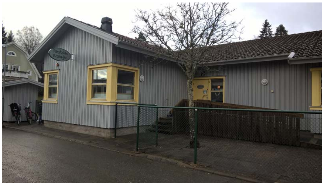
Förskolan Kastanjen, framsidan av fastigheten som vetter mot norr.

Vi har avgränsat arbetet till den lilla förskolan i Alingsås kommun som med stor sannolikhet kan jämföras med liknande objekt uti landet.