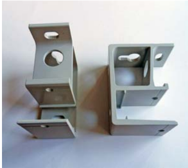
Illustration 2: Konsol