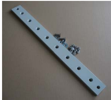
Illustration 1: Stödlist