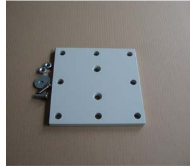
Illustration 4: Stödplatta

Konsolen som används i beräkningarna har ett hålavstånd på 7,5cm. Till denna konsol finns en list som ökar avståndet mellan infästningarna. Listen kapas av i önskad längd. Här kommer hålavståndet 22,5cm att användas. Till konsolen finns även olika varianter av stödplattor.