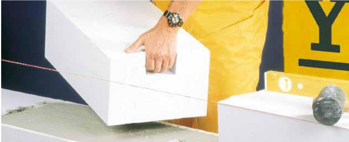
Bild 1 ytong

En nackdel är att gasbetongens värmekonduktivitet, \lambda -värde, är högre (sämre) än för t ex mineralull eller cellplast. Så den får lite högre U-värde)om den byggs av gasbetong i stället för t ex med lättreglar och mineralull. Så länge väggen består av bara lättbetong.