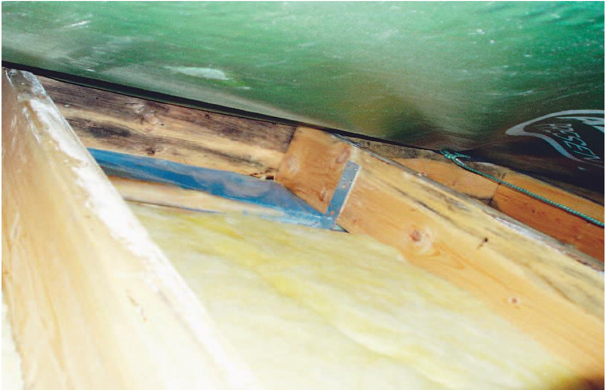
Bild : Trästemmen var angripen av mögel och blånadssvamp, mest längst ut (kallast) och längst upp (termik). Det gröna i övre delen av bilden är den provisoriska intäckningen av den frilagda väggdelen. "Bild tagen från företaget https://www.byggmiljogruppen.se .

Från deras artikel: Fukt i Ytterväggar som publicerades i Sveriges äldsta byggtidning Bygg & teknik 8/07