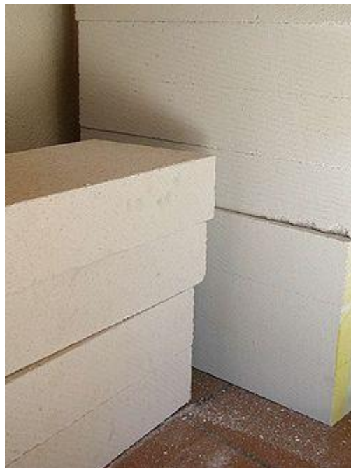
Bild 2 Ytong