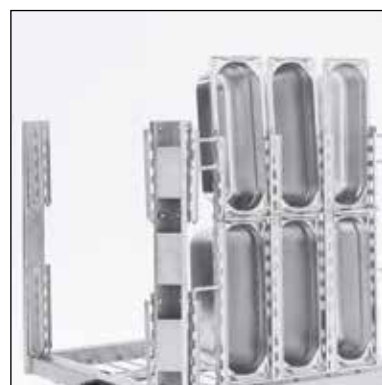
Hållare för 1/3-, 1/6- samt 1/9-kantiner. Art.nr. 209.7366