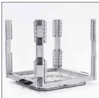
Kombikassett. Art.nr. 209.7340 Ingår i leveransen.