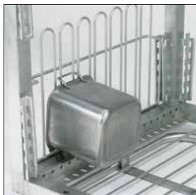
Hållare för ABC-kantiner. Art.nr. 209.7356