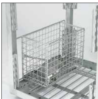
Nätkorg Art.nr. 209.7357