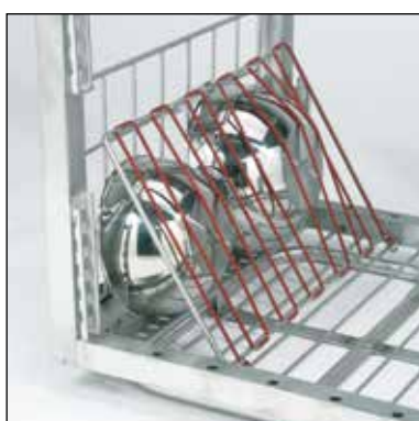
Flexibel insats. Art.nr. 209.7351 Används tillsammans med grytgaller.