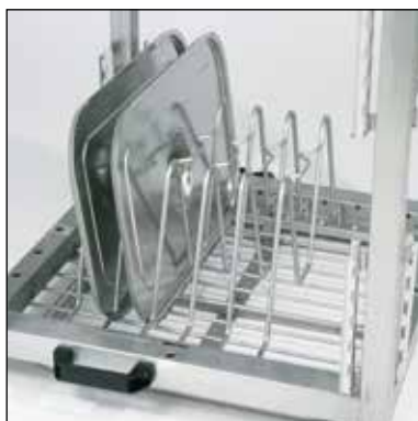
Stödvägg för kantiölock. Art.nr. 209.7341 Ingår i leveransen.