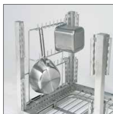
Allroundhållare Art.nr. 209.7350

Ovanstående tillbehör är ett urval av Wexiödisk's sortiment. Hjälpmedel för stackning av olika typer av diskgod's utvecklas och offereras på begäran.