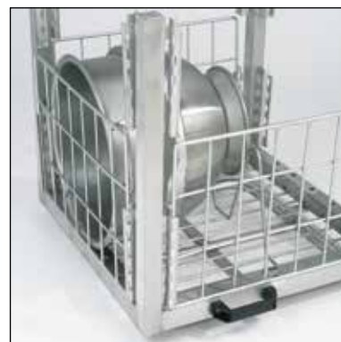
Grytgaller. Art.nr. 209.7354 Ingår i leveransen.