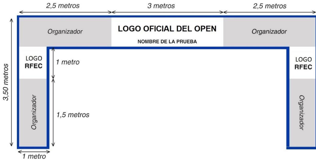
IMAGEN DE LA ZONA DE META. Respetando el espacio reservado para la RFEC y patrocinador principal si lo hubiera que se indica en la siguiente imagen.

IMAGEN DEL PUENTE DE META. Crear las lonas del puente de meta con el diseño y medidas aproximadas de la siguiente imagen. El Organizador deberá enviar el diseño a la RFEC para su aprobación.