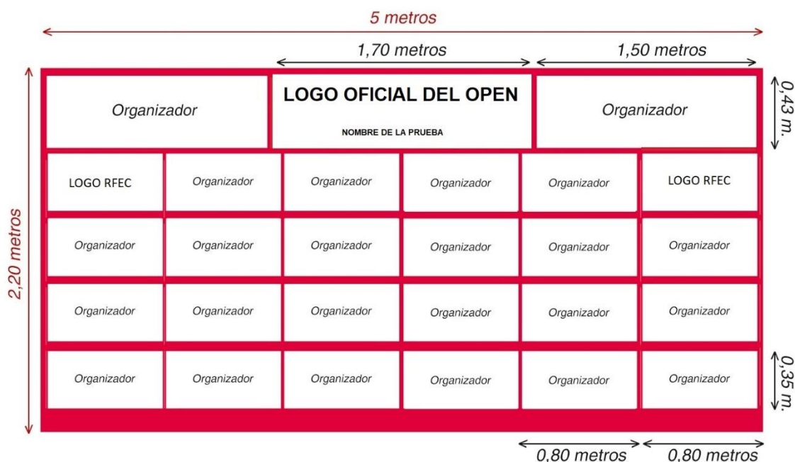
IMAGEN DEL PODIO. Crear la lona de podio con el diseño y medidas aproximadas de la siguiente imagen. El Organizador deberá enviar el diseño a la RFEC para su aprobación.

SEÑALIZACIÓN INFORMATIVA. Se establecerá una señalización vial en toda la zona del Open que informe, de forma permanente durante la duración del mismo, de los principales puntos de interés: oficina permanente, acceso a los recorridos, salidas de la ciudad, etc., contando y siendo única y exclusiva responsabilidad del Organizador el disponer de todos los permisos y autorizaciones que sean requeridos.