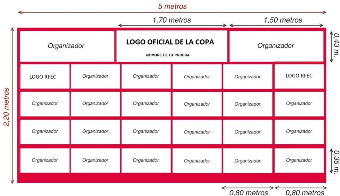
IMAGEN DEL PUENTE DE META. Crear las lonas del puente de meta con el diseño y medidas aproximadas de la siguiente imagen. El Organizador deberá enviar el diseño a la RFEC para su aprobación.

IMAGEN DEL PODIO. Crear la lona de podio con el diseño y medidas aproximadas de la siguiente imagen. El Organizador deberá enviar el diseño a la RFEC para su aprobación.