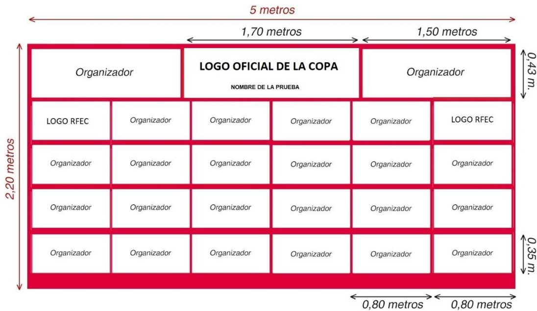
IMAGEN DEL PUENTE DE META. Crear las lonas del puente de meta con el diseño y medidas aproximadas de la siguiente imagen. El Organizador deberá enviar el diseño a la RFEC para su aprobación.

IMAGEN DEL PODIO. Crear la lona de podio con el diseño y medidas aproximadas de la siguiente imagen. El Organizador deberá enviar el diseño a la RFEC para su aprobación.