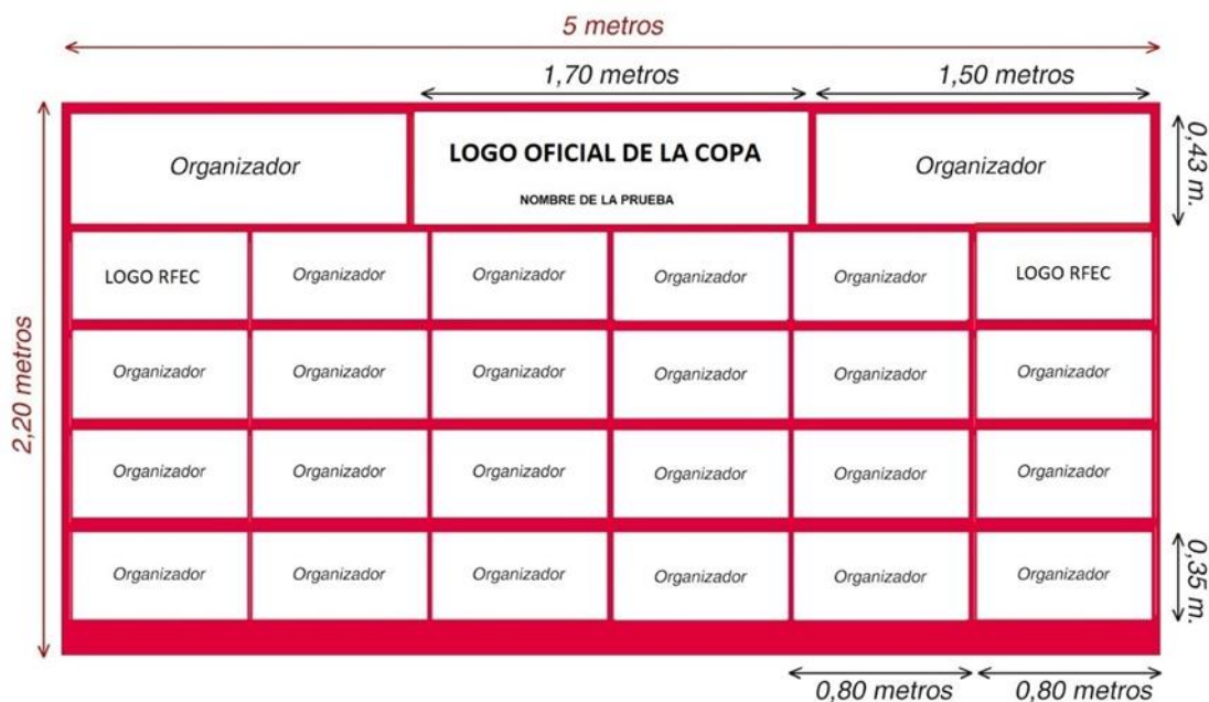
IMAGEN DEL PUENTE DE META. Crear las lonas del puente de meta con el diseño y medidas aproximadas de la siguiente imagen. El Organizador deberá enviar el diseño a la RFEC para su aprobación.

IMAGEN DEL PODIO. Crear la lona de podio con el diseño y medidas aproximadas de la siguiente imagen. El Organizador deberá enviar el diseño a la RFEC para su aprobación.