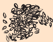
British Grown Linseed