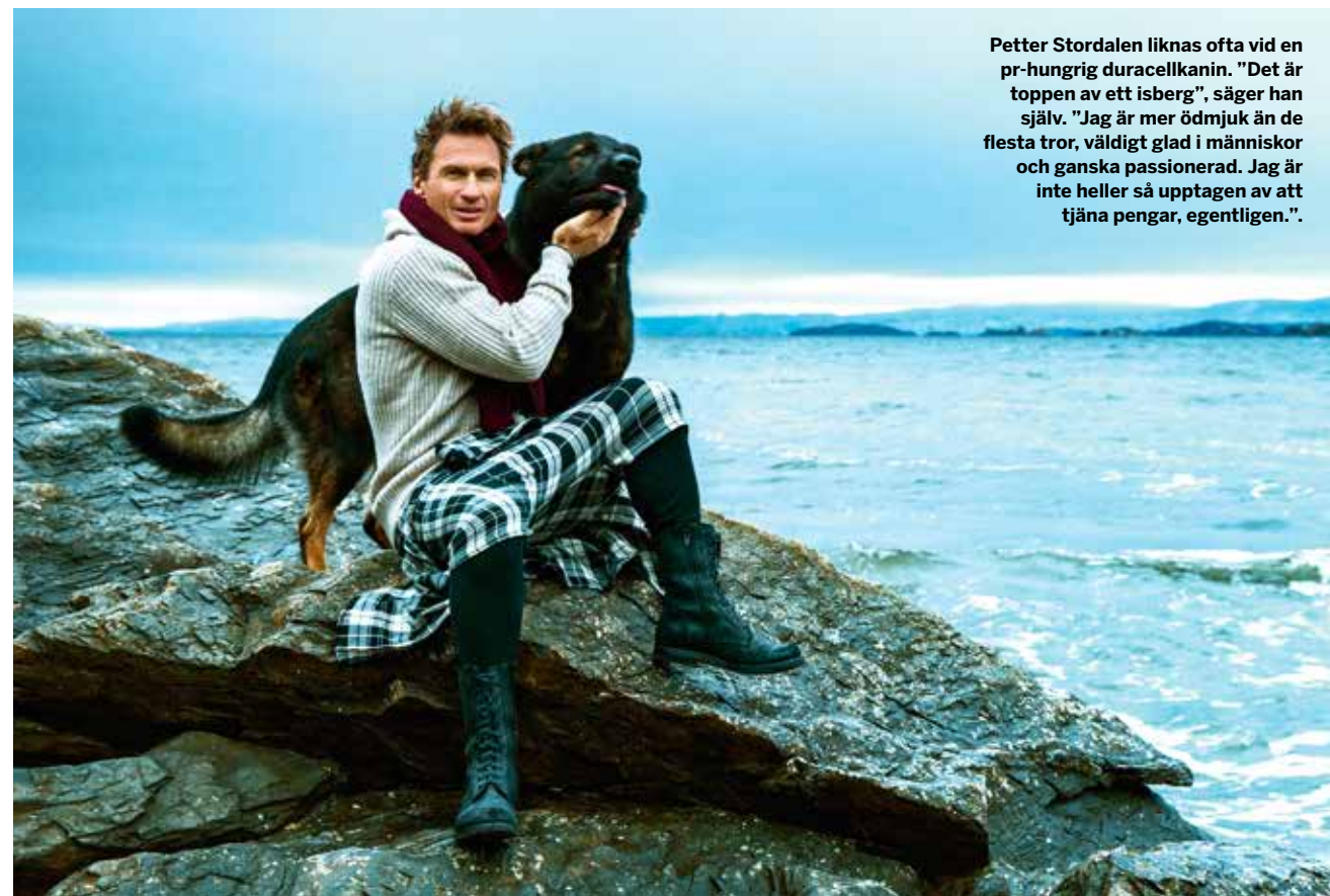
Petter Stordalen liknas ofta vid en pr-hungrig duracellkanin. "Det är toppen av ett isberg", säger han själv. "Jag är mer ödmjuk än de flesta tror, väldigt glad i människor och ganska passionerad. Jag är inte heller så upptagen av att tjäna pengar, egentligen."

"Jag kompromissar inte med våra idéer. Jag vet att jag kan påverka tusentals människor. Det är ingen tillfällighet att Nordic Choice sätter hållbar mat på dagordningen utan det har så klart med Eat att göra (Gunhild Stordalens globala satsning för nya hållbara och miljövänliga lösningar för mat och hälsa). Inte heller att jag pratar om vikten av att vara och göra annorlunda. Vi har människor från 129 nationer anställda. Om du inte har en plan, då säsar du bara runt. Du måste lägga makt bakom de ting du önskar uppnå."