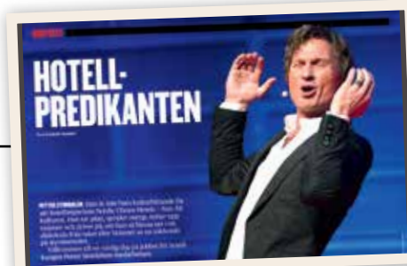
I TOPPEN AV I LEDARLIGAN, 34 POÄNG I CHEFTESTET