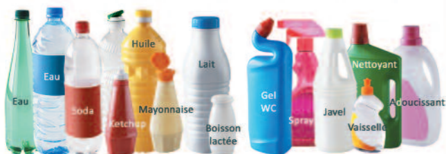
Bouteilles et flacons