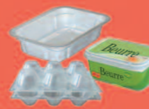
Boîtes en plastique