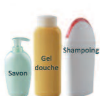
Produits de toilette