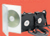
Cassettes, CD, DVD