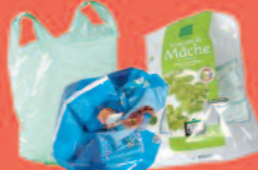
Sacs en plastique