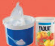
Pots de yaourt

Les déchets du quotidien, à jeter dans la poubelle ordinaire.