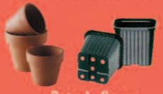
Pots de fleurs