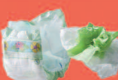
Couches, Papiers absorbants