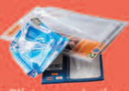
Blisters en plastique