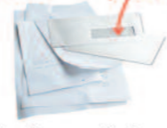
Enveloppes, Papiers, Courriers