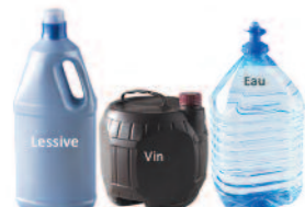
Cubiteiners, bidons, Fontaines à eau