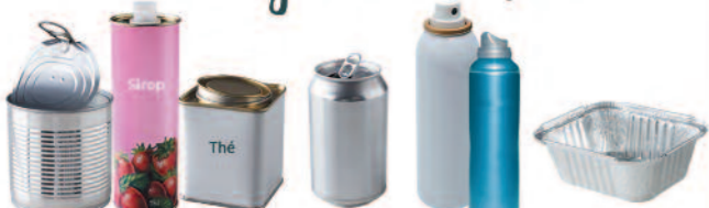
Boîtes de conserve