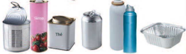
Boîtes de conserve