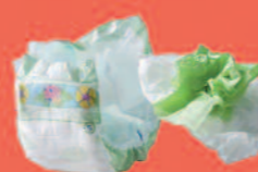
Couches, Papiers absorbants