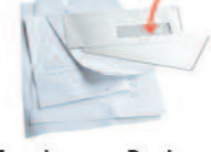
Enveloppes, Papiers, Courriers