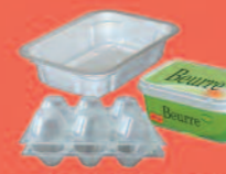
Boîtes en plastique