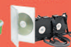
Cassettes, CD, DVD