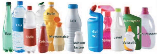
Bouteilles et flacons