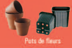
Pots de fleurs