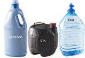
Cubiteiners, bidons, Fontaines à eau