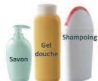
Produits de toilette