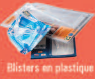
Blisters en plastique