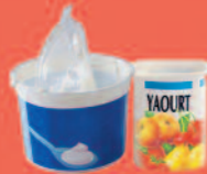
Pots de yaourt

Les déchets du quotidien, à jeter dans la poubelle ordinaire.