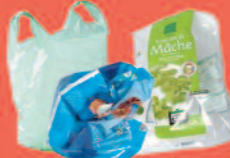
Sacs en plastique